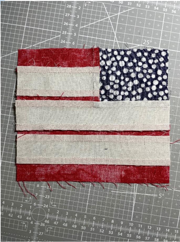
Fahne von hinten

Die Fahne oben und unten mit einem schönen Stoff „auffüllen“, damit am Ende eine Gartenfahne daraus entstehen kann.