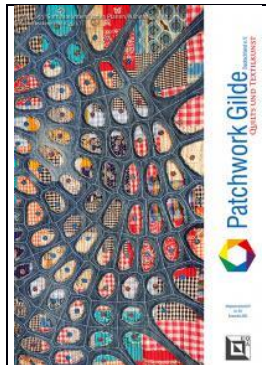
Dezember 2023 Heft 153