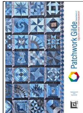
September 2023 Heft 152