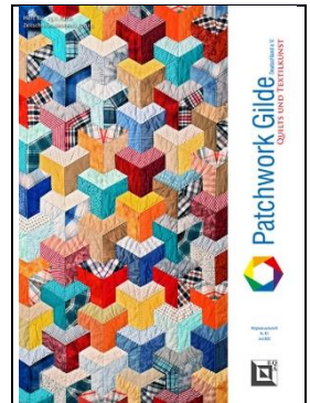
Juni 2023 Heft 151