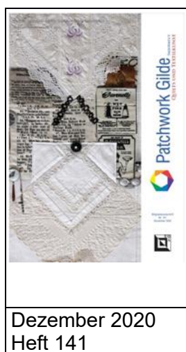
Dezember 2020 Heft 141