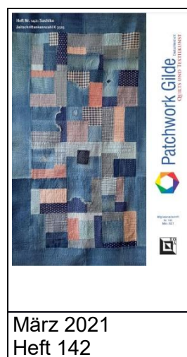
März 2021 Heft 142