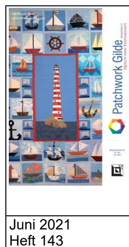
Juni 2021 Heft 143